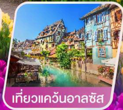
เที่ยวแคว้นอาลซัส