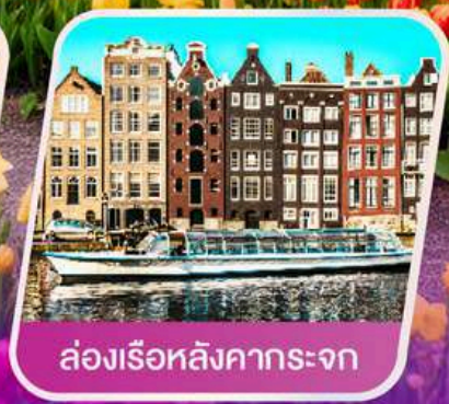
ล่องเรือหลังคากระຈก