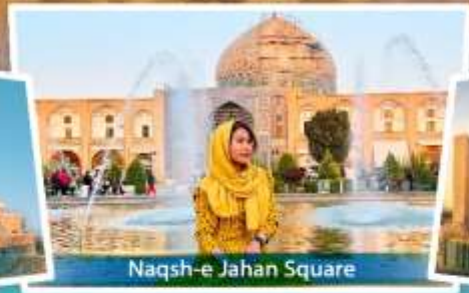
Naqsh-e Jahan Square