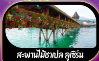
สะพานไม้ชาเปล คูชีเรน