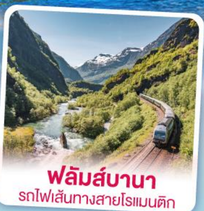
พหลิมส์บานา รถไฟเส้นทางสายโรเมนติก