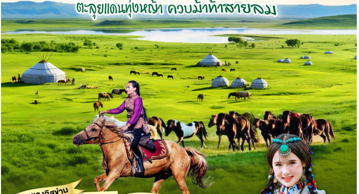
สุสานเจงกิสข่าน