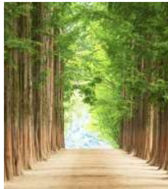
เรื่อง Winter Love Song

06.20-08.40 น. เดินทางถึงสนามบินนานาชาติอินชอน (หรือเทียบเท่า) เป็น สนามบินที่ทันสมัย สะอาด ปลอดภัย และได้รับมาตรฐานระดับโลก ท่านจะต้องผ่าน ด่านควบคุมโรค และด่านตรวจคนเข้าเมือง หลังจากนั้นออกมาพบกับมัคคุเทศก์นำ เที่ยวยังจุดนัดพบ เพื่อออกเดินทางท่องเที่ยว