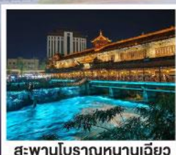
สะพานโบราณหนานเฉียว