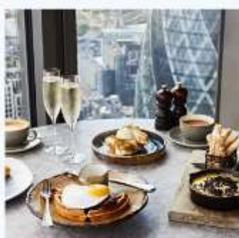
DUCK AND WAFFLE