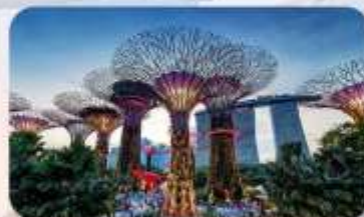
Gardens by the Bay