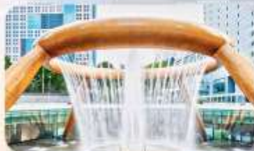
Fountain of Wealth