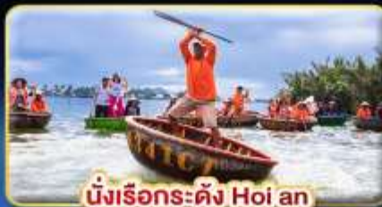
นั่งเรือระดั่ง Hoi an