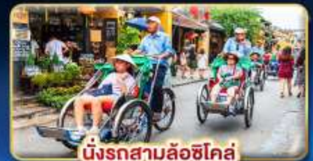
นั่งรถสามล้อฮิโค่