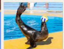
POLAR OCEAN PARK