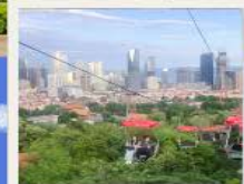
กระเช้าชมเมือง