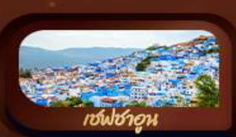
เชฟชาอูน