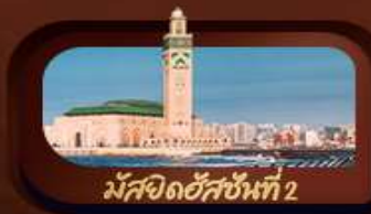
มัสยิดอัลฮักซันที่ 2