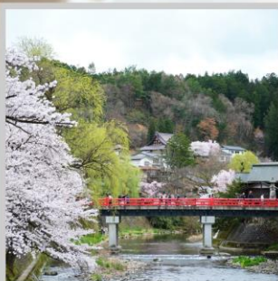
“TAKAYAMA OLD TOWN”