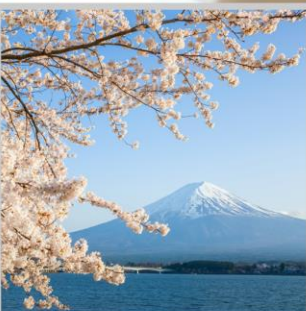
“LAKE KAWAGUCHIKO SAKURA”