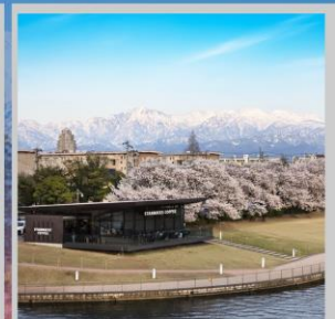
“TOYAMA KANSUI PARK”