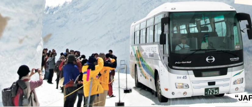
“JAPAN ALPINE ROUTE”