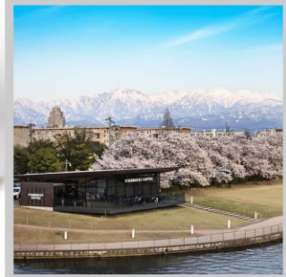
“TOYAMA KANSUI PARK”