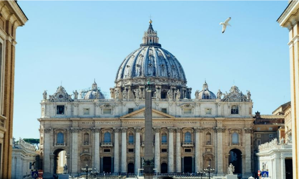
มหาวิหารนักบุญปีเตอร์ ( ST. PETER' BASILICA)

(กรณีมีพิธีด้านใน หรือถ้าหากมีผู้เข้าชมเป็นจำนวนมากจนไม่สามารถเข้าชมได้ทันเวลา ทั้งนี้เพื่อมิให้กระทบต่อกำหนดการท่องเที่ยวอื่นๆ ภายในโปรแกรมทัวร์" อาจจะไม่ได้รับการเข้าชม)