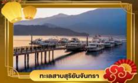
ทะเลสาบสุริยอินจินตรา