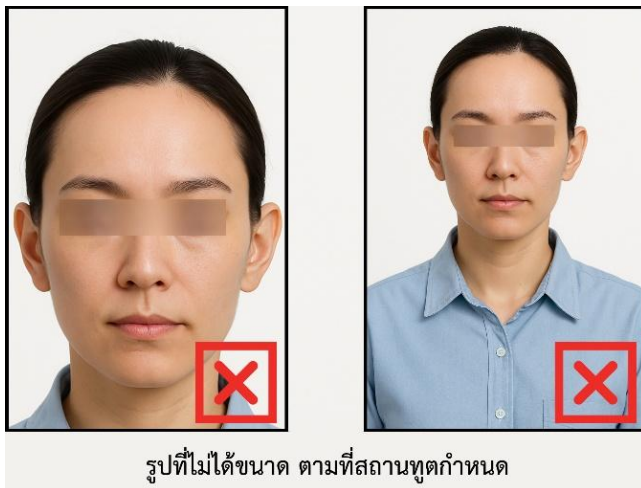
รูปที่ไม่ได้ขนาด ตามที่สถานทูตกำหนด