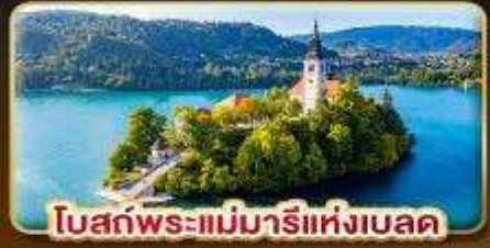
โบสถ์พระแม่มารีย์แห่งเบลด