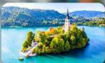
โบสถ์พระแม่มาเรียแห่งเบลค