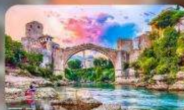
บอสเนียและเฮอร์เซโกวีนา