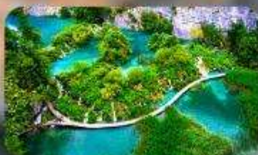
อุทยานแห่งชาติพลิตวิเซ่