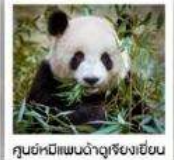
ศูนย์หมีแพนด้าดูเจียงเยียน