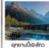
อุทยานปี้เผิงโกว