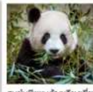
ศูนย์อนุรักษ์หมีแพนด้าจู่เจียงเยียน