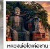
หลวงพ่อดเล่อซาน