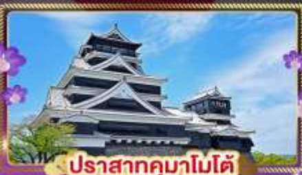
ปราสาทคุมาโมโตะ