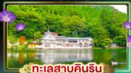
ทะเลสาบคินริน