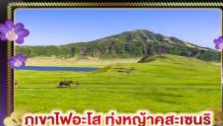
ภูเขาไฟอะโฮะ ทุ่งหญ้าคุสะเซนริ