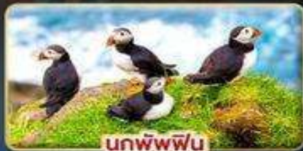
นกพิงฟิน

📅 เดินทาง : 30 เม.ย. - 07 พ.ค. | 23-30 ก.ค. 69