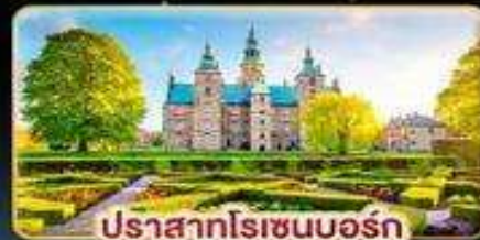
ปราสาทโรเซนบอร์ก