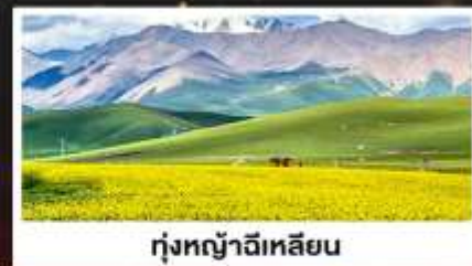
ทุ่งหญ้าจีเหลียน