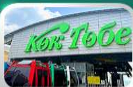
ซิมบูลัคทอเบซิมวอลมาตี

นั่งกระเช้าซิมบูลัค • ทะเลสาบโคลไซ • โบสถ์เซนมคอฟ