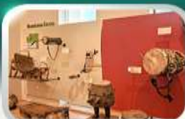
Museum of Folk Instrument