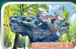
Panfilov Guardsmen Park