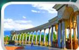
1st President Park