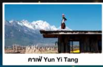
คาเฟ่ Yun Yi Tang