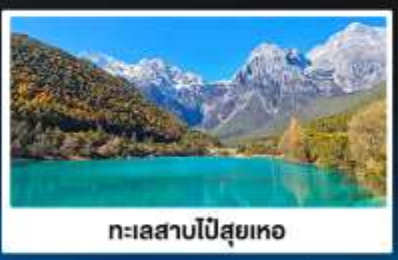
ทะเลสาบโป๋สยห่อ