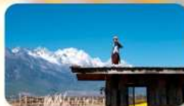
กาแฟ Yun Yi Tang