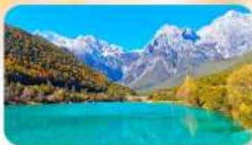
ทะเลสาบไป๋สุยเหอ