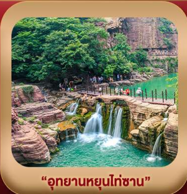
“อุทยานหยุนไท่ซาน”

ชมกำแพงเหมิน มรดกโลกที่เมืองลั่วหยาง • สุสานจีนซีฮ่องเต้ • ศาลเจ้ากวนอู วัดเส้าหลิน + ป่าเจดีย์ + ชมโชว์กังฟู • เมืองโบราณลั่วอี้ • อุทยานหยุนไท่ซาน เจดีย์ห่านป่าใหญ่ • ถนนวัฒนธรรมต้าถัง • ถนนคนเดินอิสลาม • จัตุรัสหอระฆัง