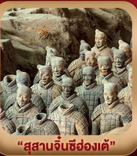
“สุสานจีนซีฮ่องเต้”