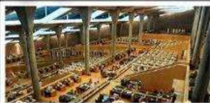
ห้องสมุดอเล็กซานเดรีย