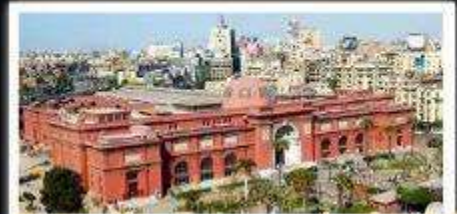
พิพิธภัณฑ์สถานแห่งชาติอียิปต์