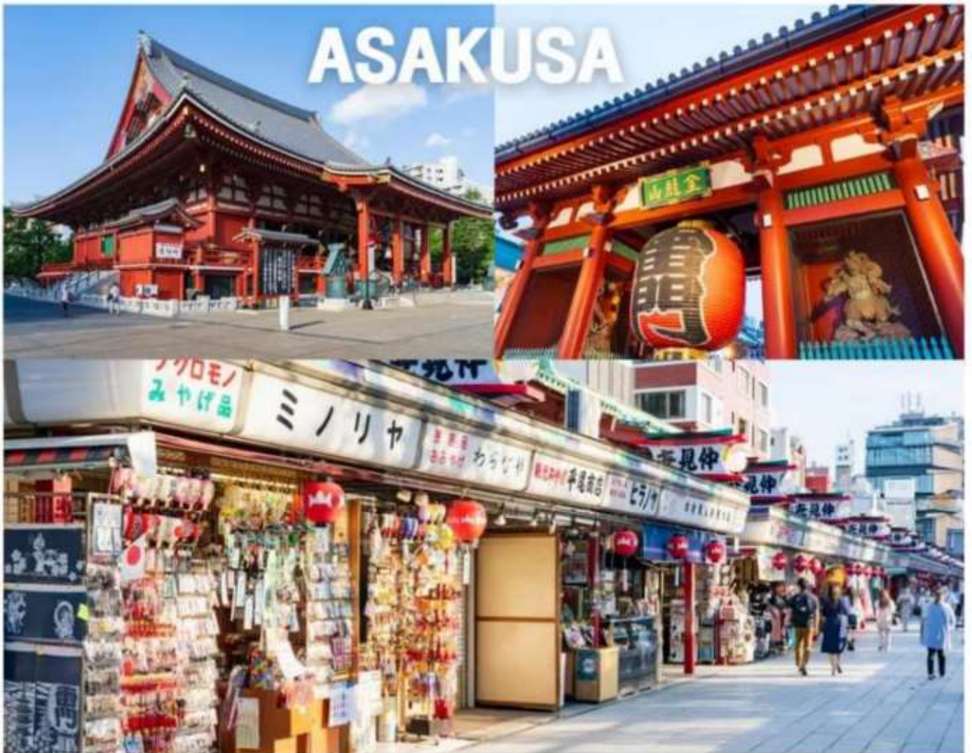
PJPNRT27-SL TOKYO FUJI PINK MOSS FULL DAY 5D3N

นำท่านเดินทางสู่ “มหานครโตเกียว” เพื่อนมัสการเจ้าแม่กวนอิมทองคำ ณ “วัดอาซากุสะ” วัดที่ได้ชื่อว่าเป็นวัดที่มีความศักดิ์สิทธิ์ และได้รับความเคารพนับถือมากที่สุดแห่งหนึ่งในกรุงโตเกียว ภายในประดิษฐานองค์เจ้าแม่กวนอิมทองคำที่ศักดิ์สิทธิ์ ซึ่งมักจะมีผู้คนมาราบไหว้ขอพรเพื่อความเป็นสิริมงคลตลอดทั้งปี ประกอบกับภายในวัดยังเป็นที่ตั้งของโคมไฟยักษ์ที่มีขนาดใหญ่ที่สุดในโลกด้วยความสูง 4.5 เมตร ซึ่งแขวนห้อยอยู่ ณ ประตูทางเข้าที่อยู่ด้านหน้าสุดของวัด ที่มีชื่อว่า “ประตูพิวคาร์ณ” ถนนนากามิเซะ หรือที่หลายๆคนรู้จักกันว่า “ถนนช้อปปิ้งนากามิเซะ” เป็นทางเดินทอดยาวจากถนนหลักที่ร่ว่งเข้าสู่พื้นที่ภายในของวัดนั้นแหละค่ะ เนื่องจากวัดอาซากุสะเป็นวัดยอดนิยมของโตเกียวจึงทำให้ถนนเส้นนี้เป็นถนนเส้นที่คึกคักเกือบ