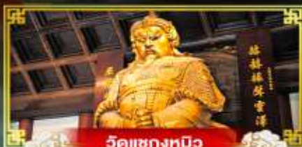
วัดเข่งทมิฬ