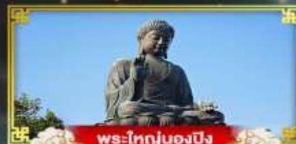
พระใหญ่ของปิง