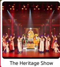
The Heritage Show