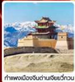
กำแพงเมืองจีนด่านเฉียนชวีกวน

• ไซโล่...เส้นทางสายไหม ชมสระบัววังพระจันทร์ ทะเลทรายหมีงาช้าง กำแพงเมืองจีนด่านสุดท้าย "เฉียนชวีกวน" มรดกโลกภูเขาสายรุ้งจางเย่