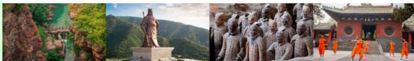
อุทยานสวรรค์หยุนโถซาน