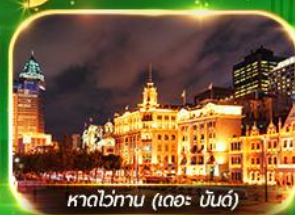
หาดไข่มุก (เดอะ บันด์)

เที่ยวมหานครเซี่ยงไฮ้ ถ่ายรูปเช็คอินที่ Tian An 1000 Trees, ซินเทียนตี้ ช้อปปิ้งตลาดเงินหวงเหมียว, ถนนนานกิง