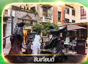
ซินเทียนตี้