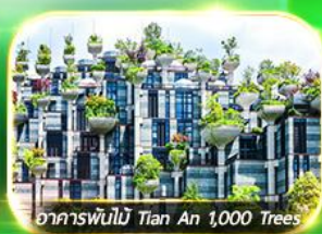
อาคารพันไม้ Tian An 1,000 Trees