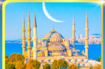
สุเหร่าสีน้ำเงิน