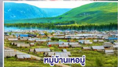
หมู่บ้านหมีขี้