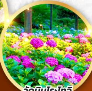
วัดมิมุโระโทจิ