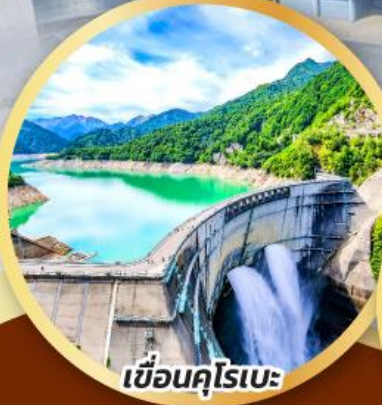
เขื่อนคุโรเบะ