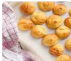
ร้าน KITAKARO ซึ่งเป็นขนมอบจากเตาสดๆ พิเศษให้เด็กๆ ชอบลิ้มชิมรสกับขนมที่สวยและเหมาะที่จะซื้อของขวัญเป็นของขวัญ