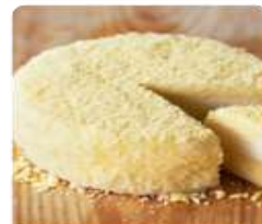
ร้าน LeTAO ร้านมีผลิตภัณฑ์อร่อย ด้วยบรรยากาศในร้านตกแต่งสวยงามไว้ที่แสนอบอุ่น อีกทั้งยังมีขนมรสหลากหลายแบบให้เลือกอีกด้วย