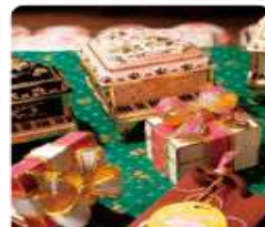
กล่องดนตรี MUSIC BOX