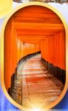
เมืองเก่าทาคายาม่า