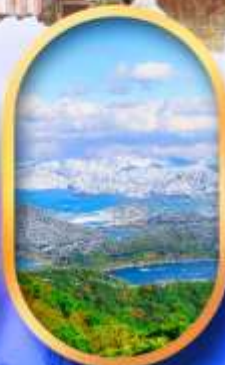
ทะเลสาบมิกะตะ