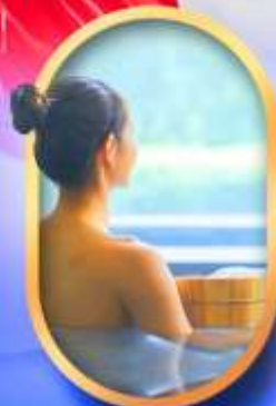
พักโรงแรมออนเซ็น