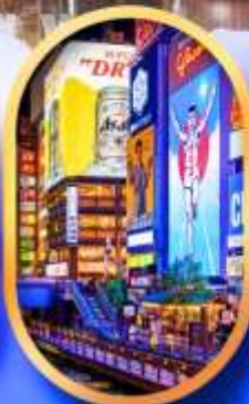
ย่านชิบโฮบาชิ