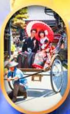
ศาลเจ้าจิ้งจอก