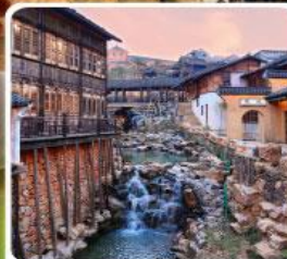
เมืองโบราณเหยาหู