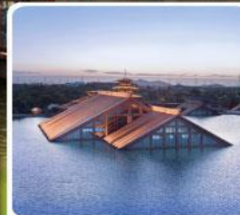
พิพิธภัณฑ์ไต้หน้ำกวงฟู่หลิน