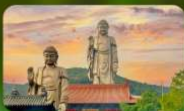
พระใหญ่หลิงชาน