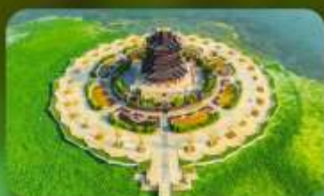
วัดฉงหยวน