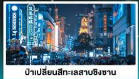
ป่าเปลี่ยนสีทะเลสาบชิงชาน