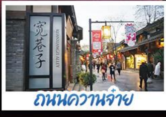
ถนนชุนชี่