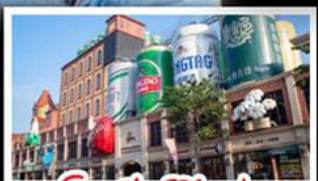
โรงแรมเป่ย์ริ่งชิงเต่า