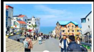
ถนนคอปเพิลิงหมายเลข 8

สัมผัสความยิ่งใหญ่ของ 4 เมืองสำคัญ ชิงเต่า - เยียนโก - เฟิงไห่ - เว่ยไห่ ปาต้ากวน - โบสถ์คาทอลิก - ตึกเก่าริมหา