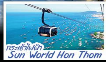
กระเช้าไฟฟ้า Sun World Hon Thom