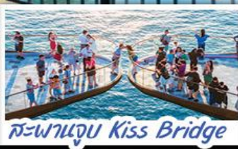
สะพานจูบ Kiss Bridge