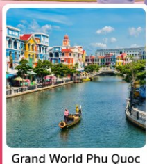
Grand World Phu Quoc