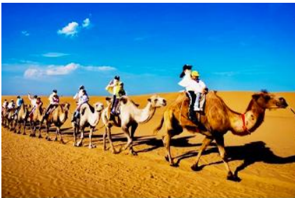
เนินทรายเลี้ยงชาวาน

เที่ยง รับประทานอาหารกลางวัน ณ ภัตตาคาร (11)