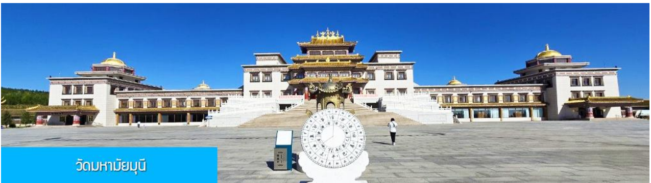
วัดมหายมุนี

พักที่ YULIN CHAOYANG INTER HOTEL โรงแรมระดับ 4 ดาวท้องถิ่น หรือเทียบเท่าในเมืองหยี่หลิน