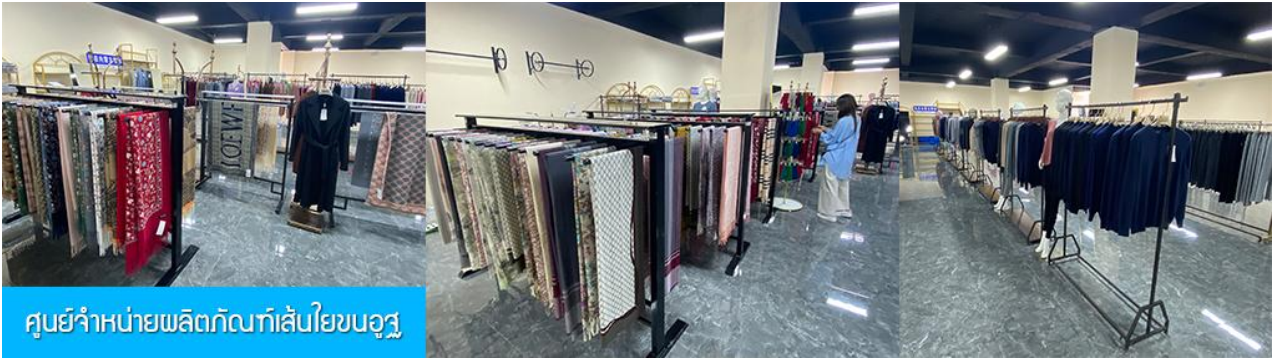
ศูนย์จำหน่ายผลิตภัณฑ์เส้นใยขนอูฐ