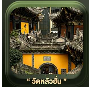
“ วัดหลัวอัน ”