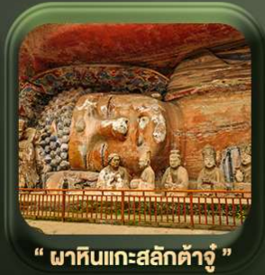
“ พาหินแเกาะสลักต้าจู้ ”