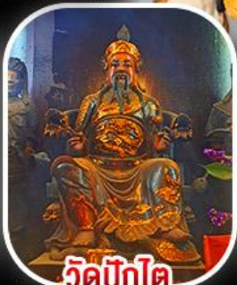
วัดปีงโต