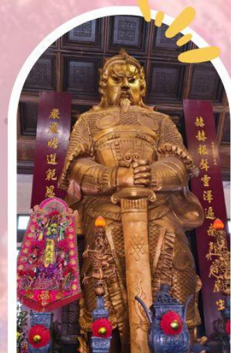
วัดแซกง ขอพรโชคลาก การเงิน และธุรกิจ