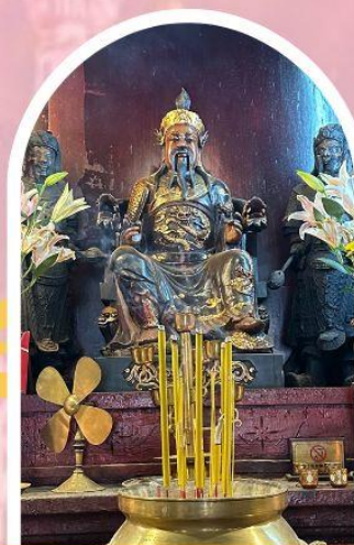
วัดปักไต้ฮ่องกง