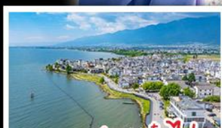
ทะเลสาบเอ๋อไห่