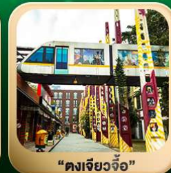
“ตงเจียวจื่อ”