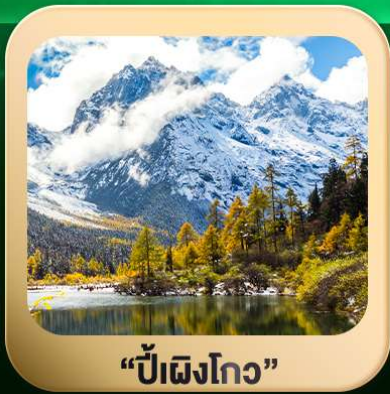
“ปี่ผิงโกว”

ชมธรรมชาติ 2 อุทยานขึ้นชื่อ อุทยานภูเขาสีดรุณี + อุทยานปี่ผิงโกว สะพานหนานเฉียว • ถนนคนเดินไท่กุ่หลี่ + ซุนซีลู่ + Pop Mart • ตงเจียวจื่อ