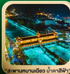
“สะพานหนานเฉียว น้ำคาสีฟ้า”