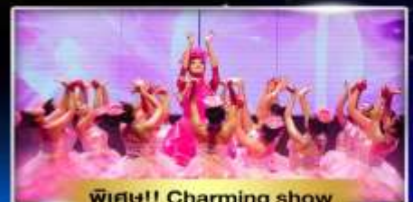
พิเศษ!! Charming show