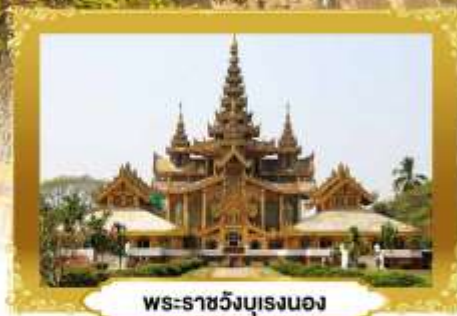
พระธาตวง์บุเรงนอง

ย่างกุ้ง • หงสาวดี • อินทร์แวงน | 3 วัน 2 คืน