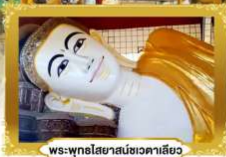
พระพุทธรูปไสยาสน์ชเวตาเลียว