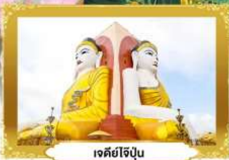
เจดีย์ไข่มุก