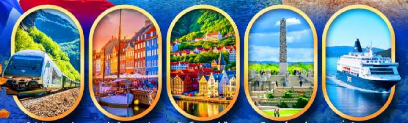
รถไฟฟลิมสขาน่า ท่าเรือฮาวน์ พักเมืองเบอร์เก็น วิกเกอร์แลนด์ นังเรือ DFDS